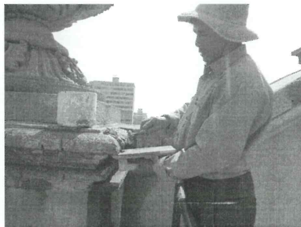
b. Proceso de la integración de repellos a base de cal en las molduras de los parapetos que rodean la azotea del Torreón Central