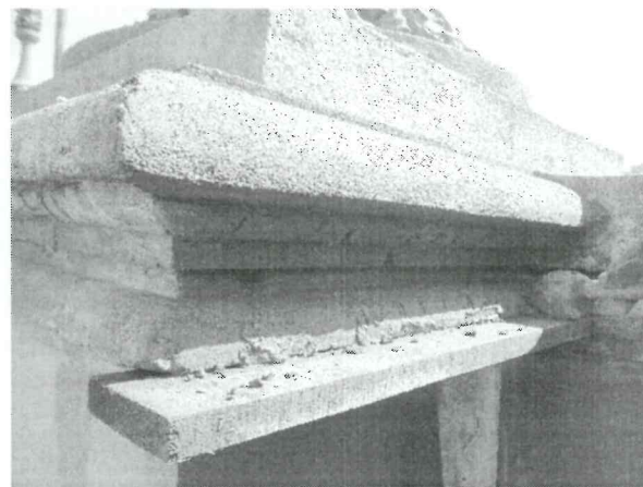
Finalización de la intervención realizada en las molduras de los parapetos.